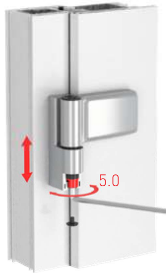
Jocker Junior PCV (80 kg/кг)